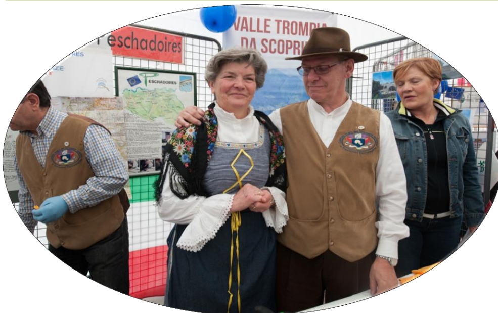
Les jumeaux italiens de Pechadoires – vendredi 10 mai 2013

Et si cela faisait un sujet pour la journée de formation ?